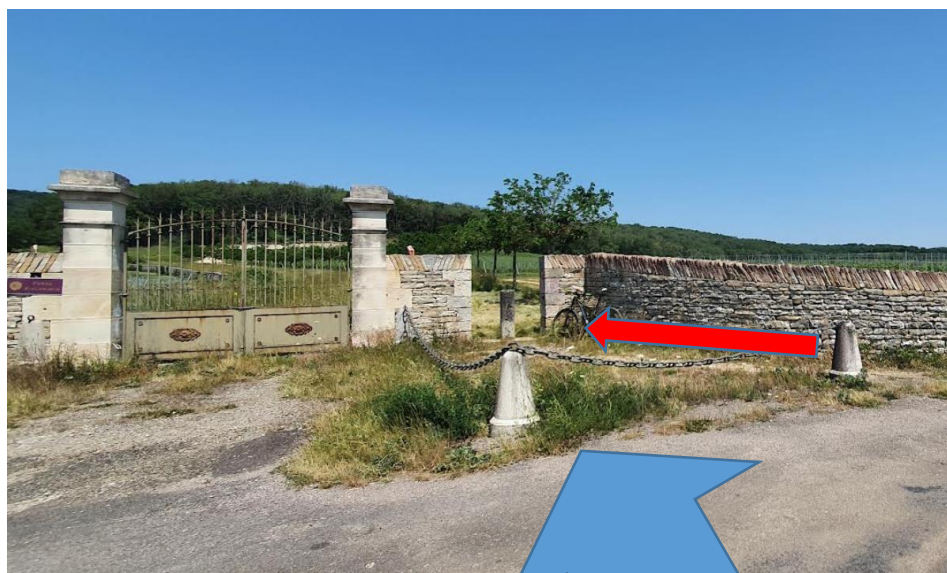
Passage derrière la chaîne et dans l'ouverture entre les murets