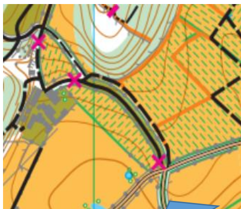
Angle de prise de vue